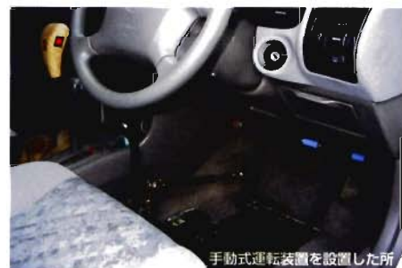
手動式運転装置を設置した所

一台の教習車を通常の運転と手動運転の両方に利用することで、利用率を上げることが出来ます。