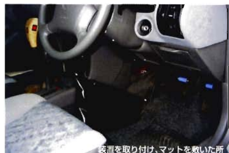
装置を取り付け、マットを敷いた所