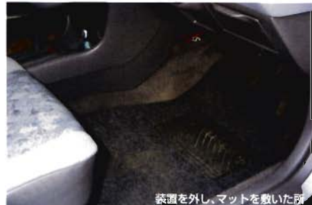
装置を外し、マットを敷いた所